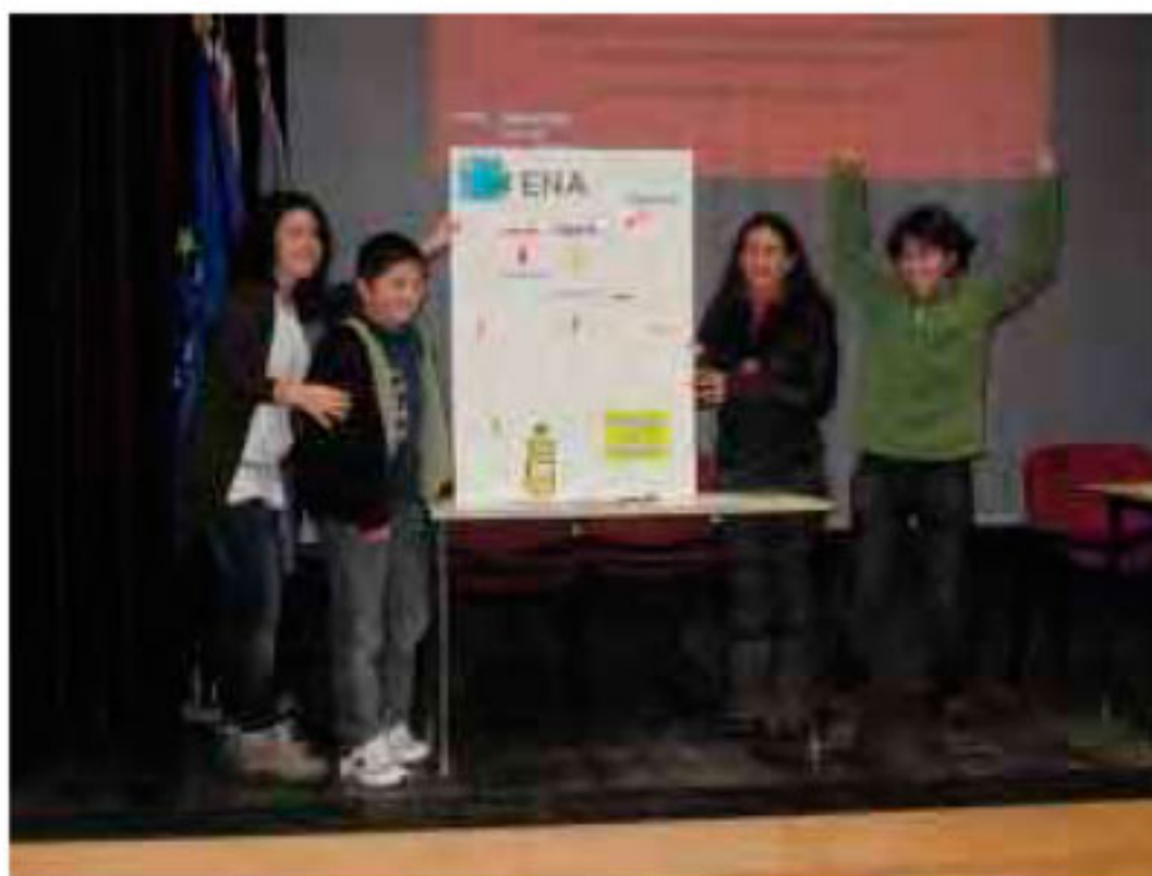
Participação entusiasta de alguns alunos.

Nos dias 9 e 10 de Fevereiro, no auditório da escola, houve uma sessão de sensibilização para a Rota dos Óleos Usados para alunos e professores, promovido pela agência de Energia e Ambiente da Arrábida (ENA).